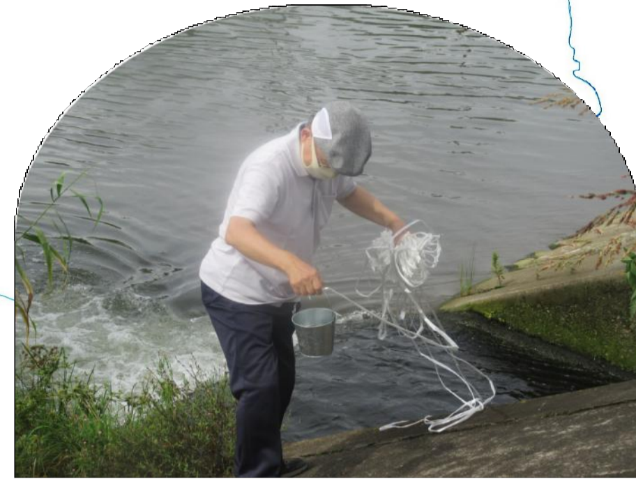
飯盛川における水質調査のための採水を行う鶴ヶ島の自然を守る会・生活クラブ生協鶴ヶ島支部