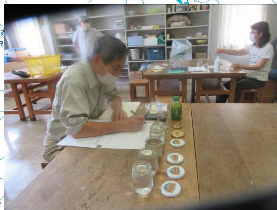
飯盛川と大谷川の水質測定(富士見市民センター)を行う鶴ヶ島の自然を守る会・生活クラブ生協鶴ヶ島支部