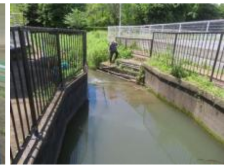
与野どんぐりの森の皆さんによる高沼用水路東縁での採水の様子（6/1）