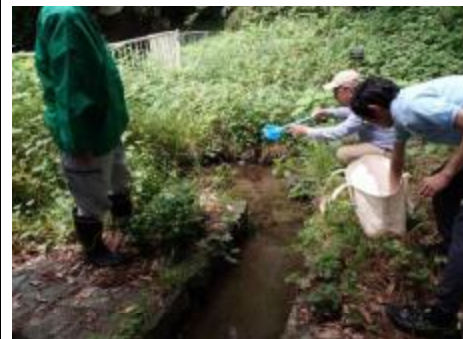
川の博物館ボランティアの会の皆さんによる宮川（川博の上流）での採水の様子（6/8）