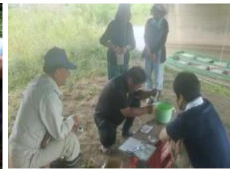
白岡市観光協会水辺の里親会の皆さんによる水質調査の実施状況（6/2）